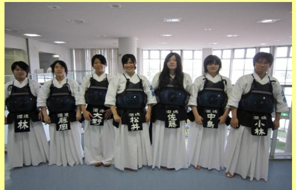
全国高等学校剣道大会 東京都予選 H22.6月