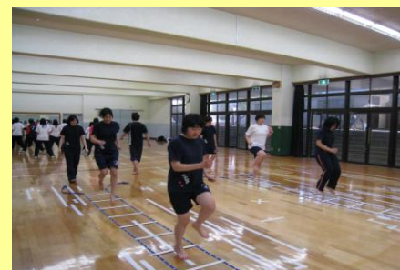
ラダートレーニング