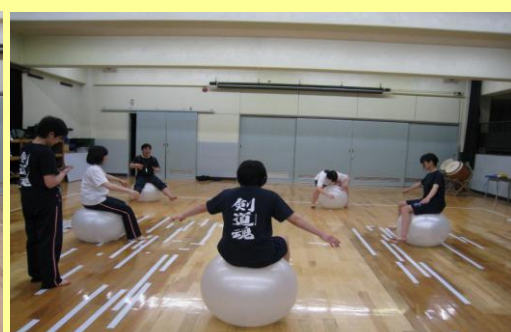
バランスボールトレーニング